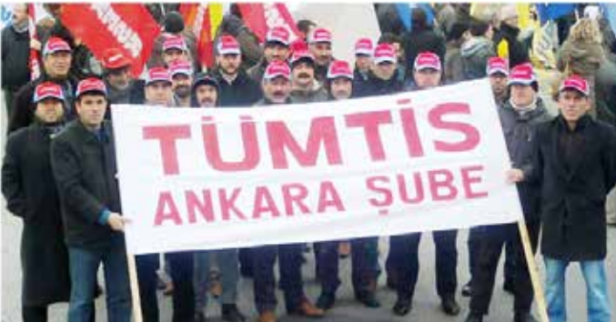
Ankara Şubemizin Başkan ve yöneticileri Ankara'da düzenlenen "Halk için bütçe" mitinginde.

Merkez Yönetim Kurulumuzun, üst örgütlerimizin ve kardeş sendikalarımızın konuya ilişkin açıklamalarını yayımlıyoruz.