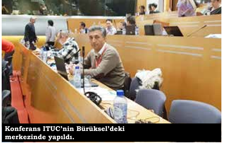
Konferans ITUC'nin Brüksel'deki merkezinde yapıldı.

• Taşıma ve lojistik sektörü giderek büyümekte, lojistik pazarı değerlendirilmektedir. Buna karşın tedarik zincirlerinde çalışma koşulları sorunludur. Örgütlenme özgürlüğü engellenmekte, maliyeti azaltma adı altında maaşları düşürme yoluna gidilmektedir.