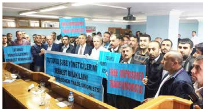
Adana ve Mersin Şubede gerçekleştirilen üye toplantılarında cezaevindeki yöneticilerimizin serbest bırakılması talep edildi.