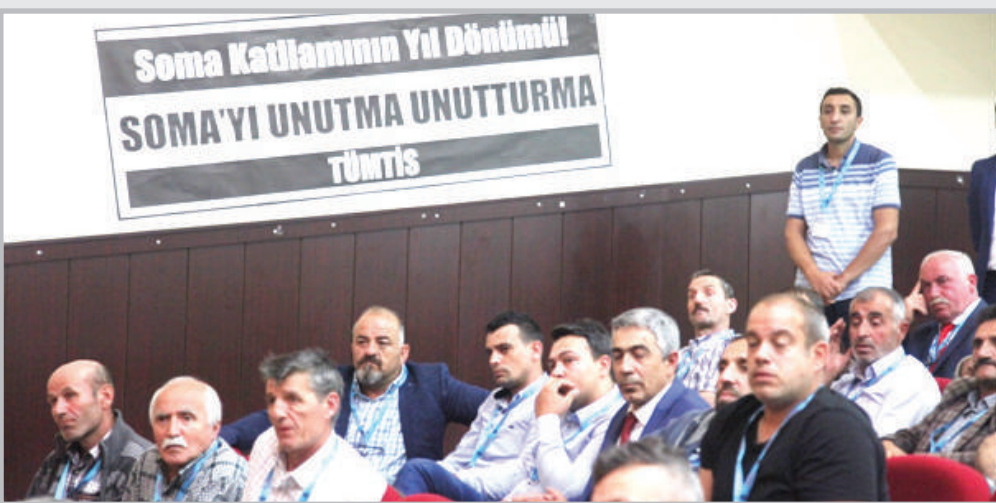
Çalışma yaşamında güvencesizlik, iş cinayetleri, özelleştirmeler ve sendikal örgütlenme önündeki engeller ile şube yöneticilerimize verilen hapis cezaları kongrede öne çıkan tepki ve talepler arasındaydı. Dördüncü yılında Soma katliamı unutulmadı.