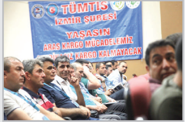
Aras Kargo, DHL Express ve Babacanlar Kargo işçileri ilk defa genel kurula katılmış olmanın heyecanını yaşadı.