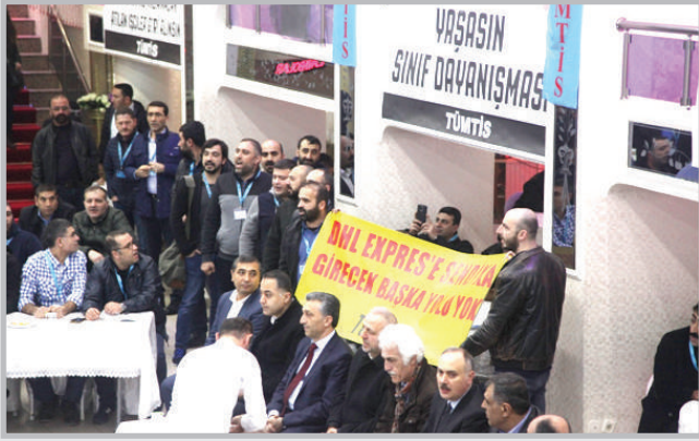
DHL Express işçileri direniş pankartıyla kongreye katıldı.