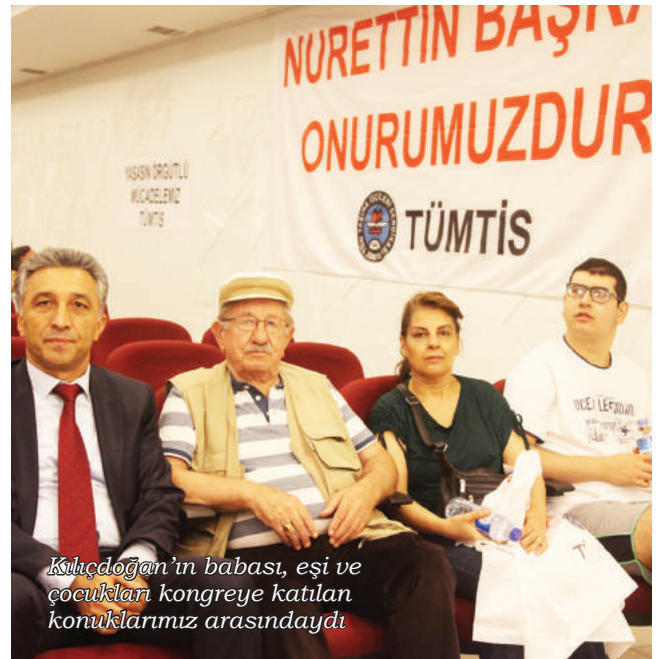
Kılıçdoğan'ın babası, eşi ve çocukları kongreye katılan konuklarımız arasındaydı